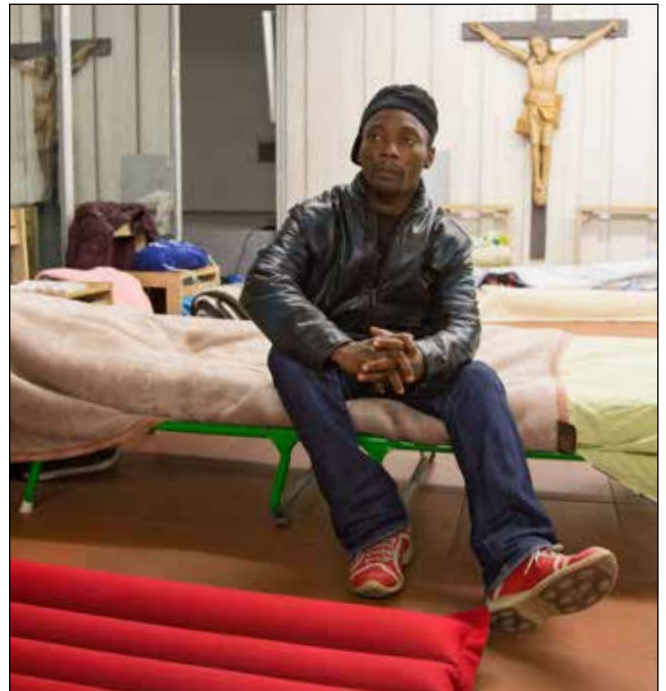
Flüchtling im Kirchenasyl in Frankfurt am Main

Bundesinnenminister Thomas de Maizière hat den Kirchen vorgeworfen, sich mit ihrer Praxis des Kirchenasyls über geltendes Recht zu stellen und die Dublin-Regel im europäischen Recht auszuhebeln. Der CDU-Politiker zog Anfang Februar einen Vergleich zwischen dem Kirchenasyl und der islamischen Scharia, die als „eine Art Gesetz für Muslime“ auch nicht über deutschen Gesetzen stehen dürfe. Die Evangelische Kirche in Deutschland (EKD) wies diese Argumentation zurück. Der Innenminister nahm den Vergleich später zurück.